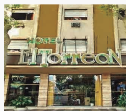
HOTEL EL TORREON